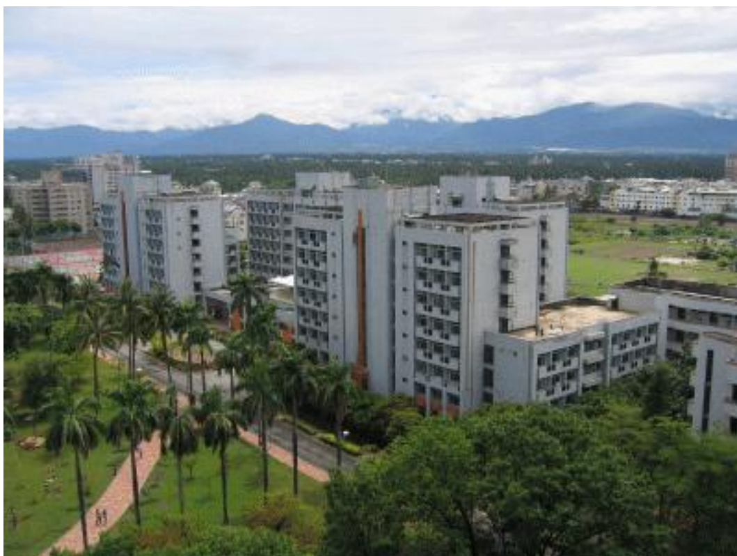
民生校區宿舍全景